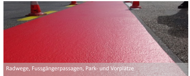
Radwege, Fussgängerpassagen, Park- und Vorplätze