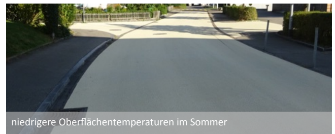
niedrigere Oberflächentemperaturen im Sommer