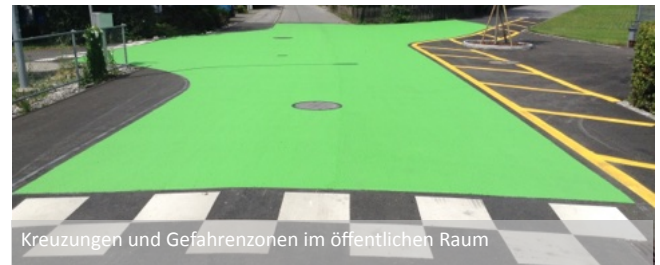
Kreuzungen und Gefahrenzonen im öffentlichen Raum