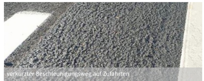
verkürzter Beschleunigungsweg auf Zufahrten